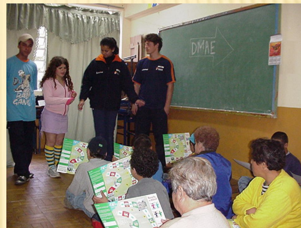
Teatro Escola Neyta Martins Ramos