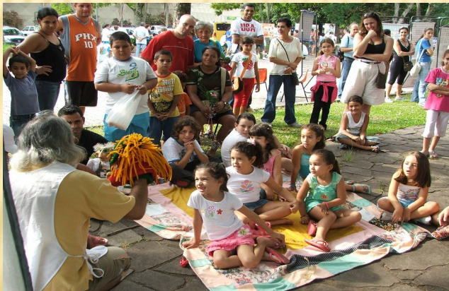
JardinAção - parceria com ONGs e Universidades