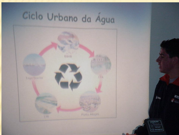
Oficina água e saneamento

Perceber a visão ecológica de forma ampla: dimensão mental, social e ambiental, integrando-os a própria realidade, gerando melhor qualidade de vida.