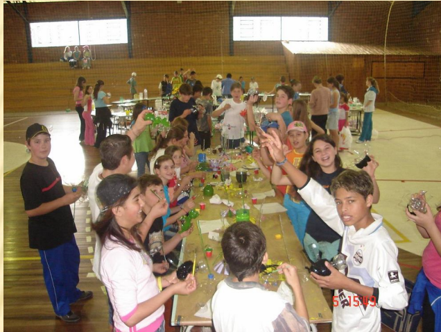
Oficina de reciclagem Nova Araçá