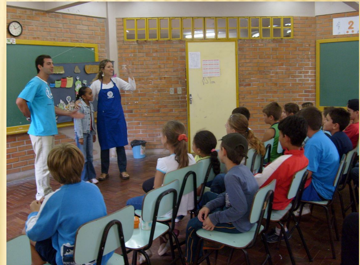
Conto “Turma do Utilixo”, Projeto Agitação