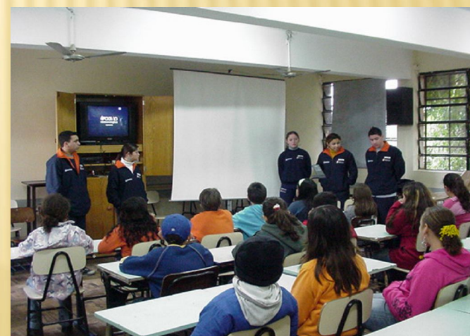
Palestra Escola Glicério Alves