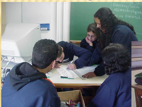
Elaboração de Projetos